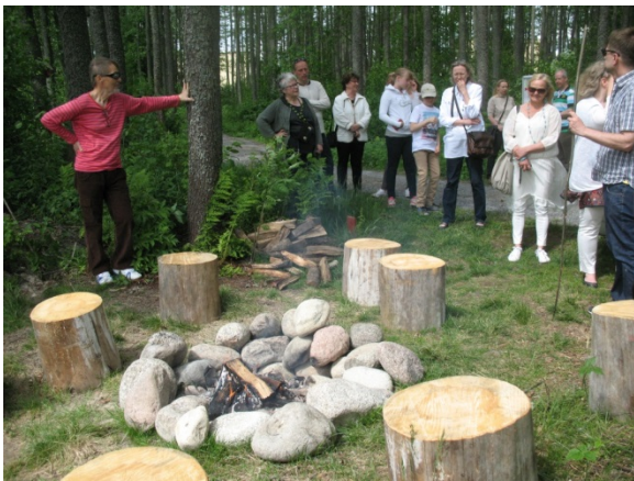
Forest Camp, Tulet