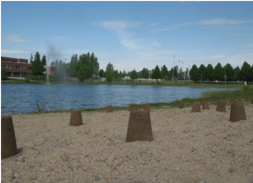
Forest Camp, Kakutus

Kesän 2015 ympäristötaidetta Jämsänjoen varrella: